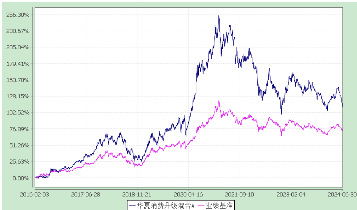
华夏消费升级混合 C