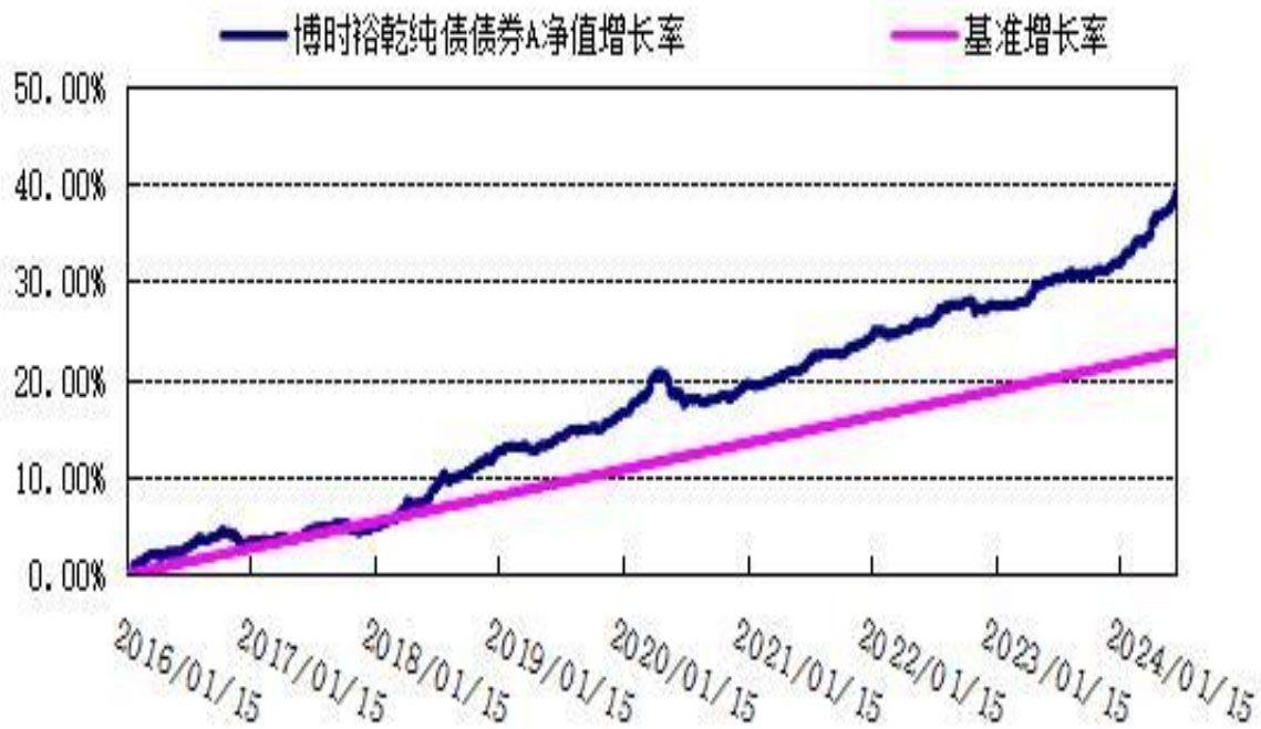
博时裕乾纯债债券 C