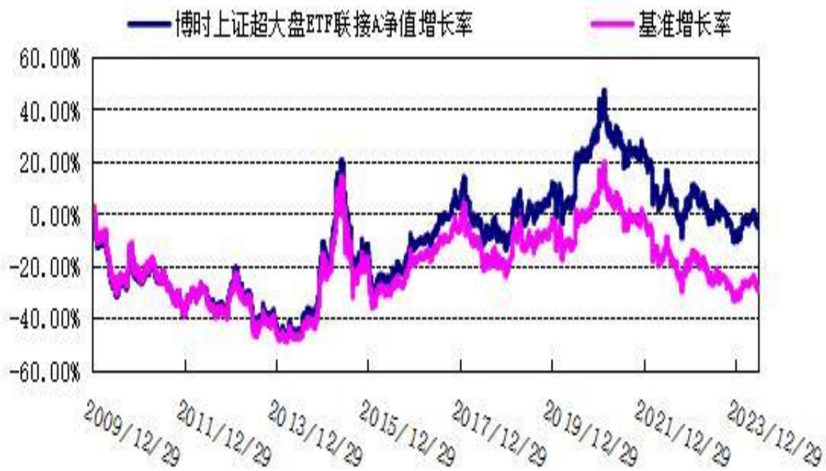
博时上证超级大盘 ETF 联接 C