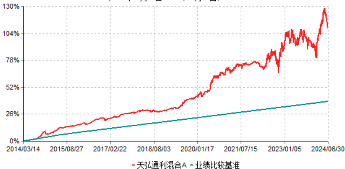
天弘通利混合A累计净值增长率与业绩比较基准收益率历史走势对比图 (2014年03月14日-2024年06月30日)