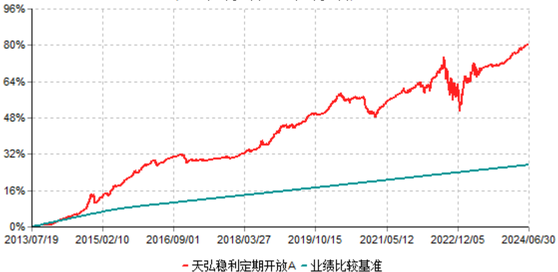
天弘稳利定期开放A累计净值增长率与业绩比较基准收益率历史走势对比图 (2013年07月19日-2024年06月30日)