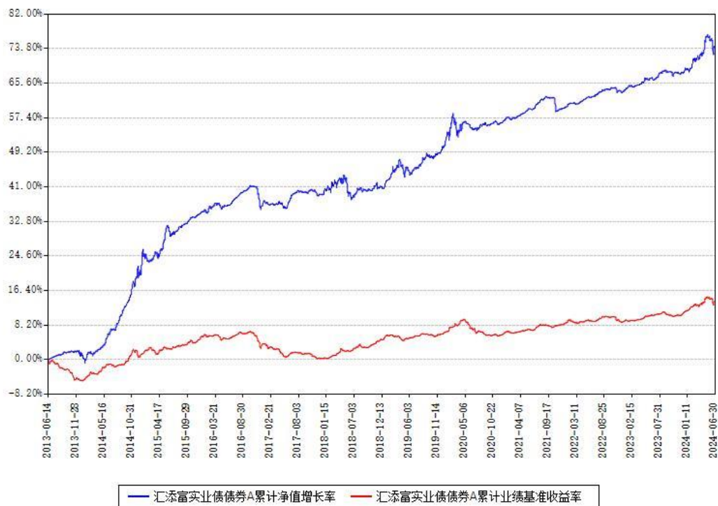
汇添富实业债债券A累计净值增长率与同期业绩比较基准收益率对比图