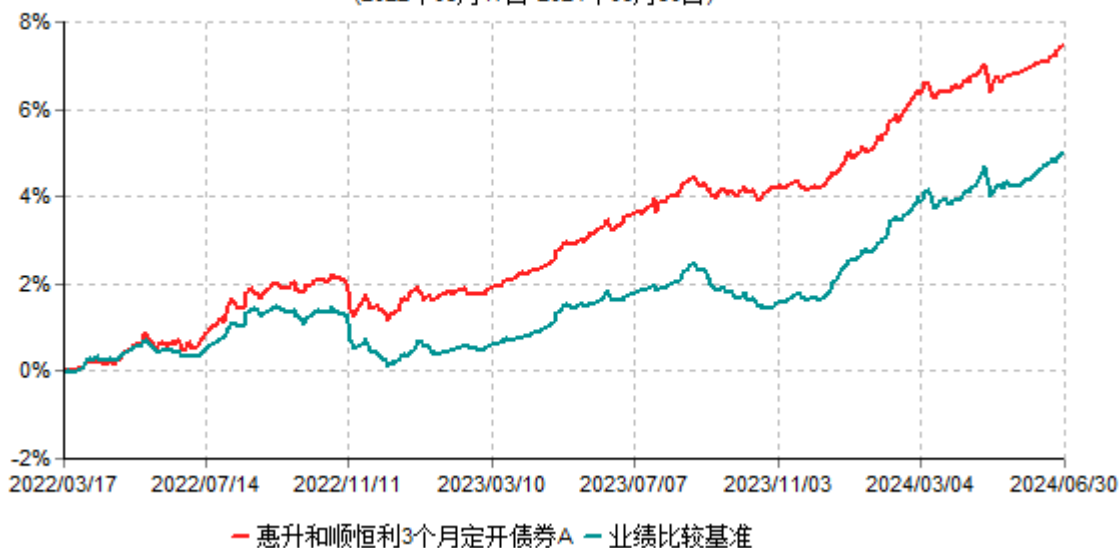
惠升和顺恒利3个月定开债券A累计净值增长率与业绩比较基准收益率历史走势对比图 (2022年03月17日-2024年06月30日)