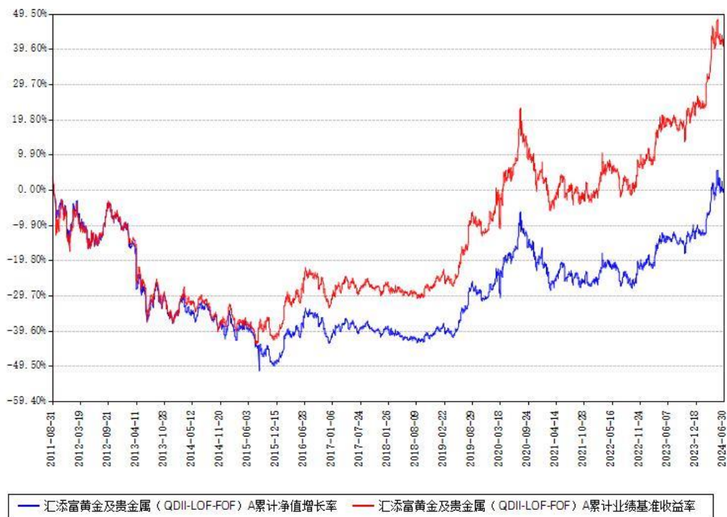
汇添富黄金及贵金属（QDII-LOF-FOF）A累计净值增长率与同期业绩基准收益率对比图

2、自基金合同生效以来基金累计净值增长率变动及其与同期业绩比较基准收益率变动的比较图