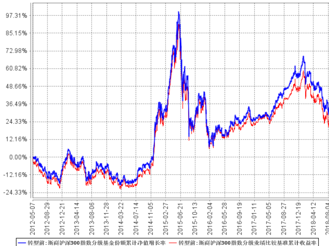
浙商沪深300指数分级基金份额累计净值增长率与同期业绩比较基准收益率的历史走势对比图