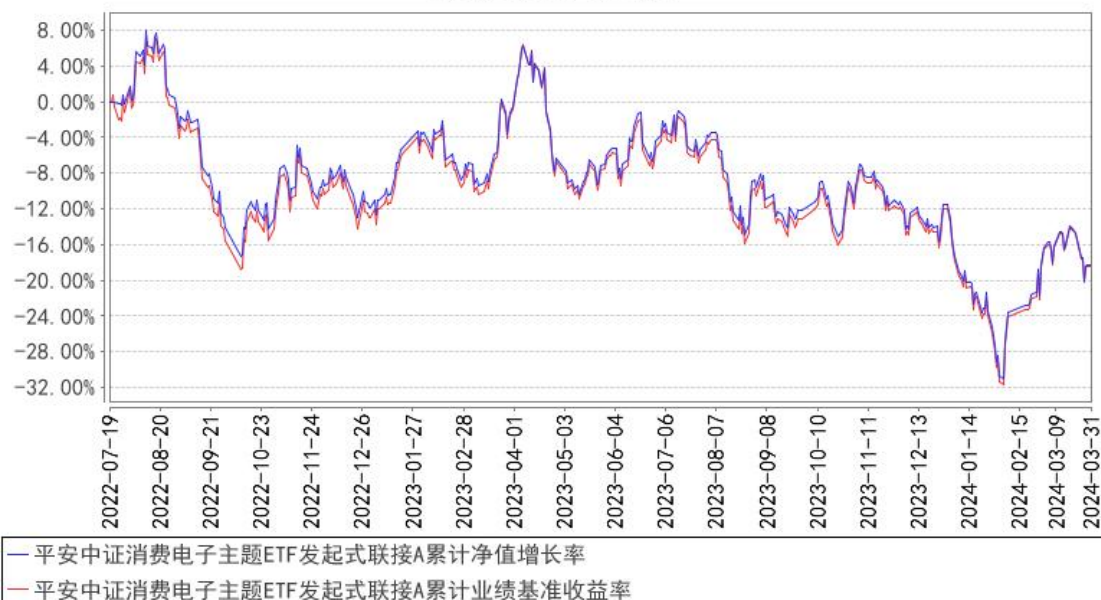
平安中证消费电子主题ETF发起式联接A累计净值增长率与同期业绩比较基准收益率的历史走势对比图