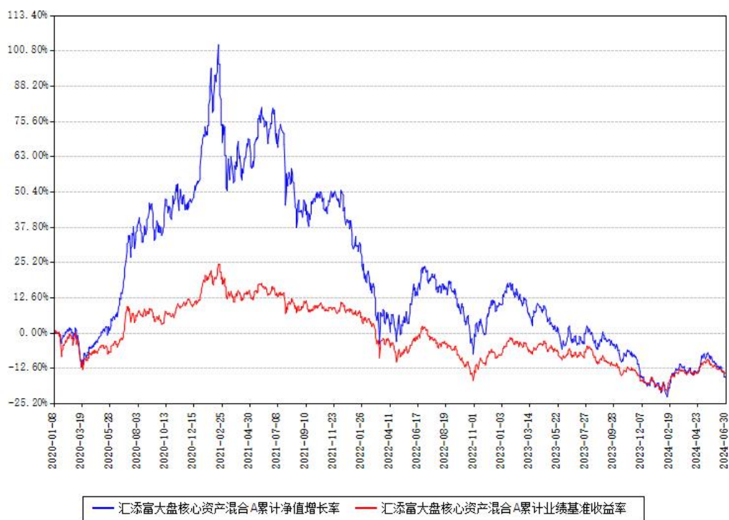
汇添富大盘核心资产混合A累计净值增长率与同期业绩比较基准收益率对比图