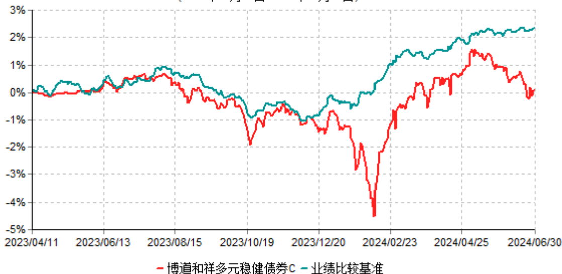
博道和祥多元稳健债券C累计净值增长率与业绩比较基准收益率历史走势对比图 (2023年04月11日-2024年06月30日)

注：本基金基金合同生效日为2023年4月11日，建仓期为自基金合同生效日起的6个月。截至报告期期末，本基金已完成建仓但报告期期末距建仓结束未满一年。截至建仓期结束，本基金各项资产配置比例符合基金合同及招募说明书有关投资比例的约定。