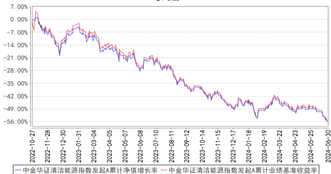
中金华证清洁能源指数发起A累计净值增长率与同期业绩比较基准收益率的历史走势对比图