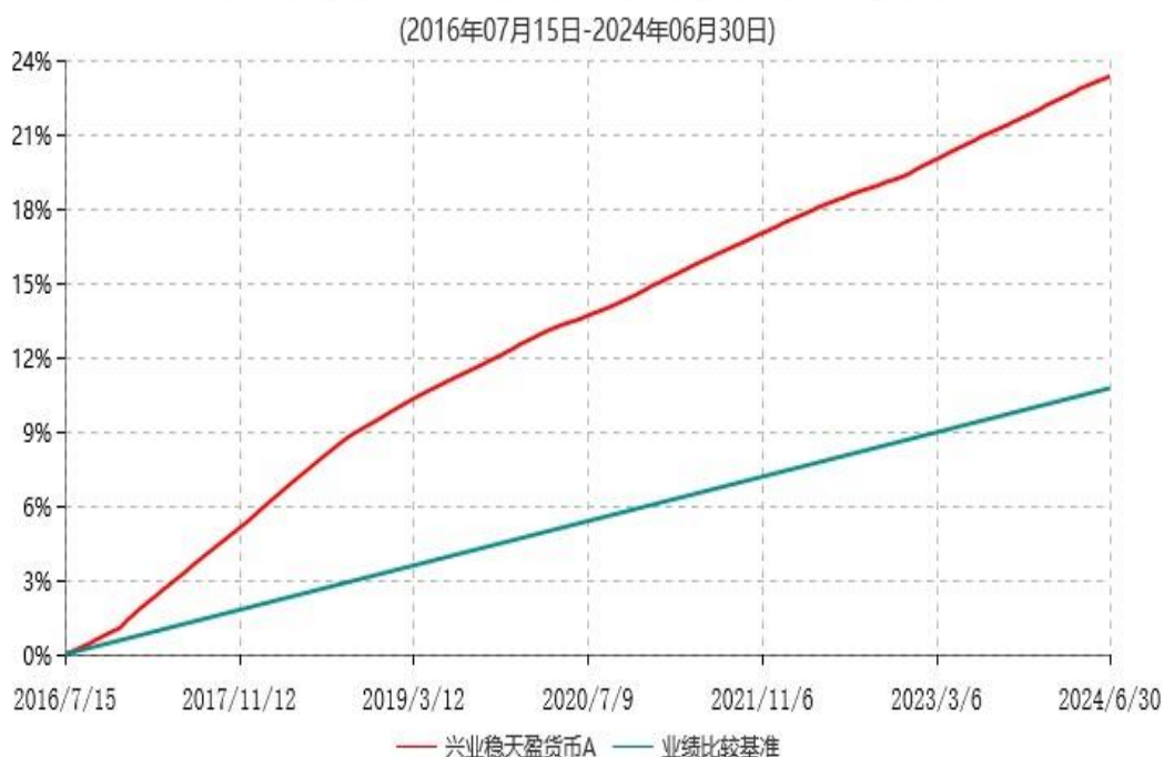
兴业稳天盈货币A累计净值收益率与业绩比较基准收益率历史走势对比图