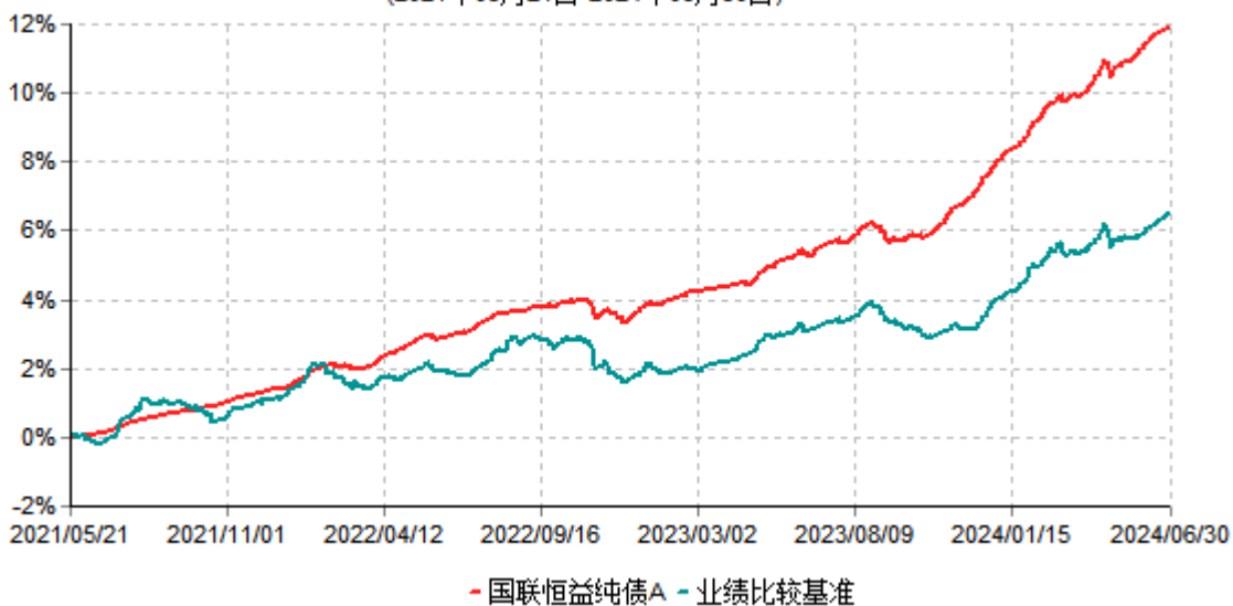
国联恒益纯债A累计净值增长率与业绩比较基准收益率历史走势对比图 (2021年05月21日-2024年06月30日)