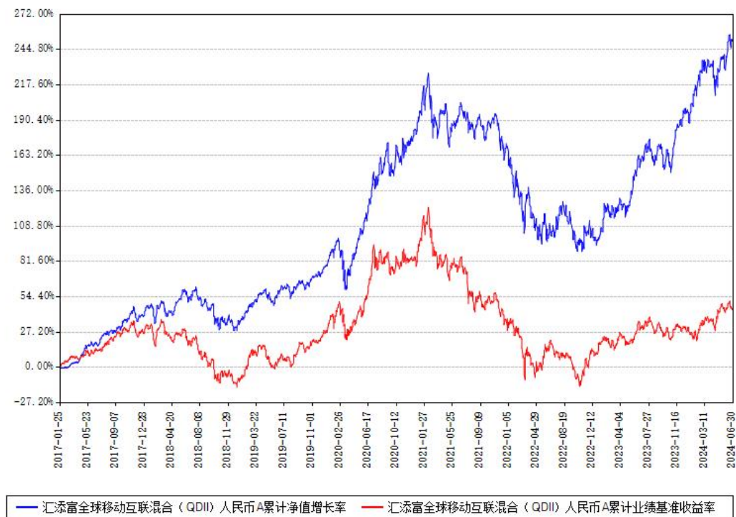
汇添富全球移动互联混合（QDII）人民币A累计净值增长率与同期业绩基准收益率对比图