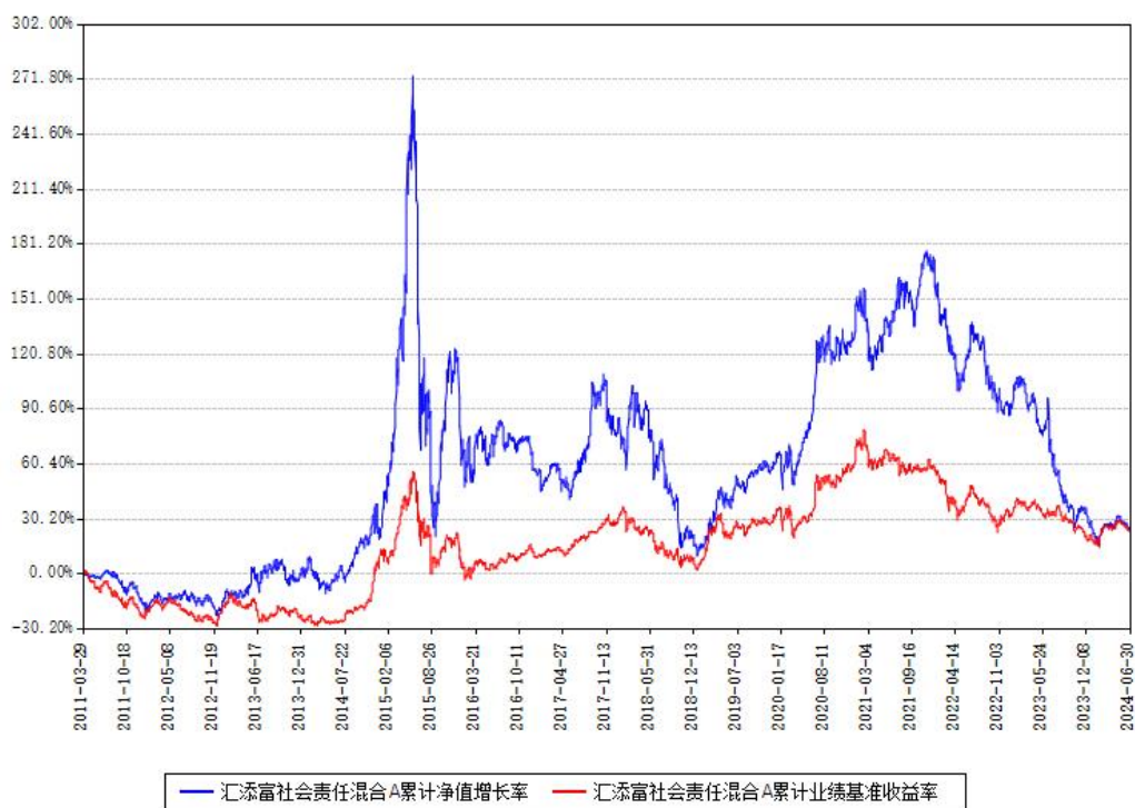
汇添富社会责任混合A累计净值增长率与同期业绩比较基准收益率对比图