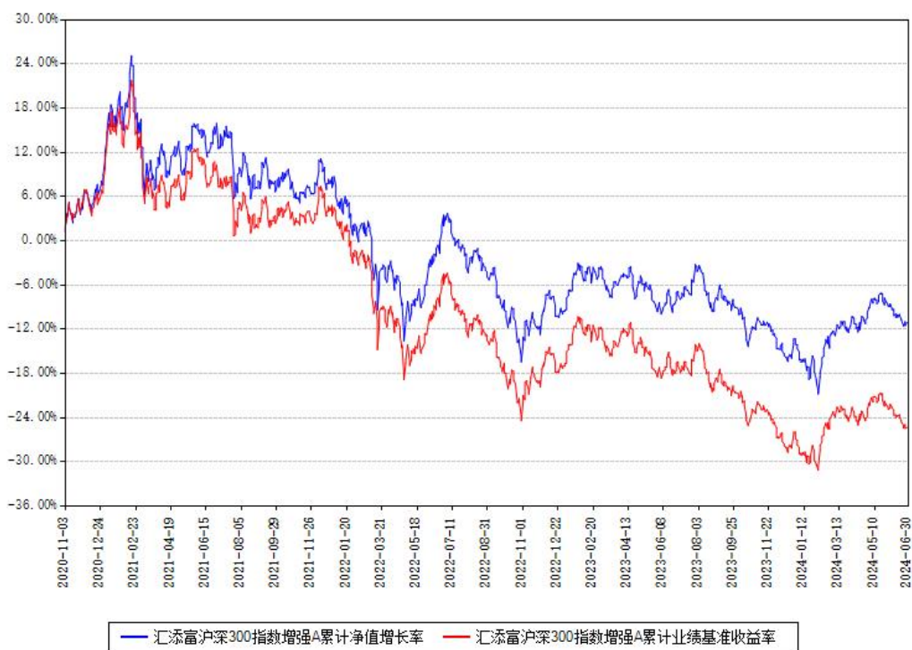
汇添富沪深300指数增强A累计净值增长率与同期业绩基准收益率对比图