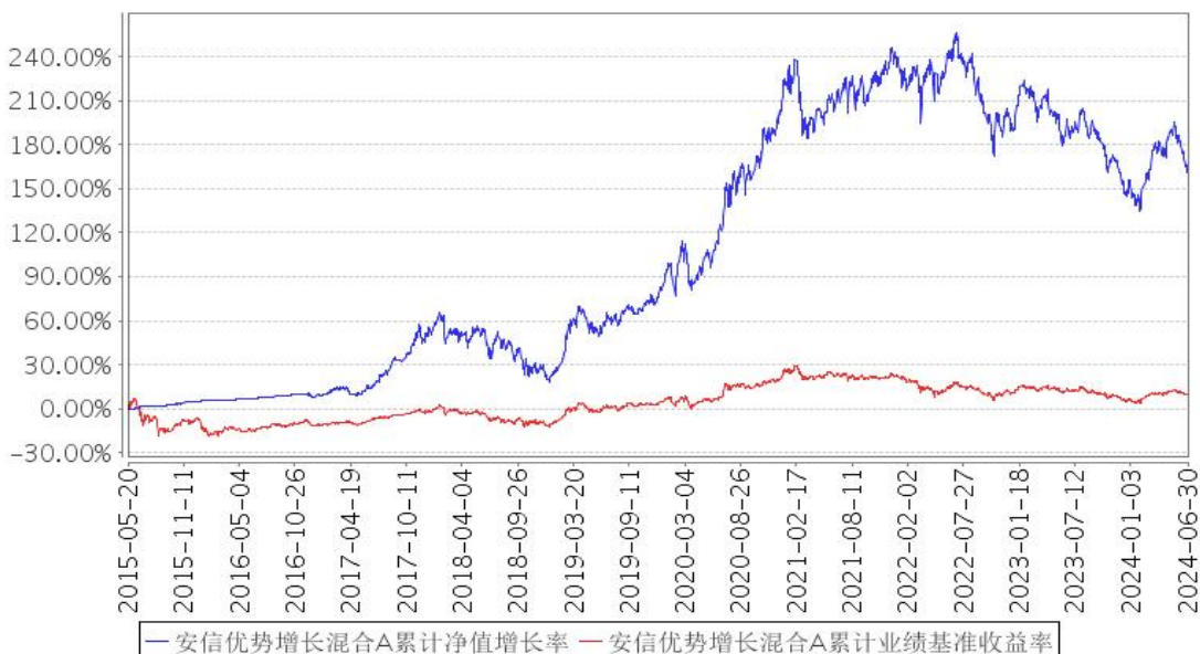
安信优势增长混合A累计净值增长率与同期业绩比较基准收益率的历史走势对比图