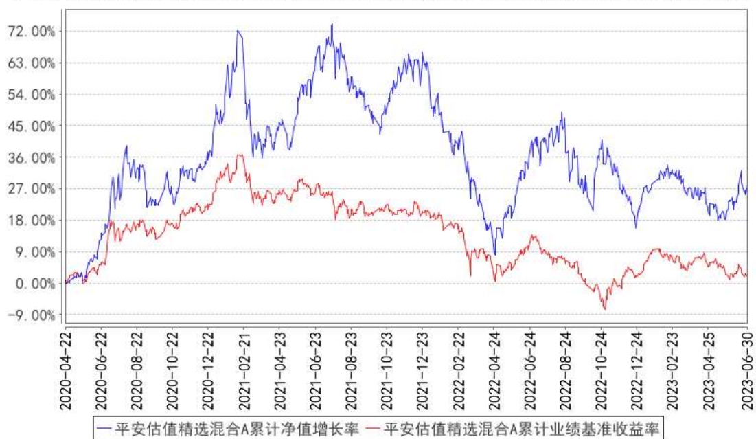
平安估值精选混合A累计净值增长率与同期业绩比较基准收益率的历史走势对比图