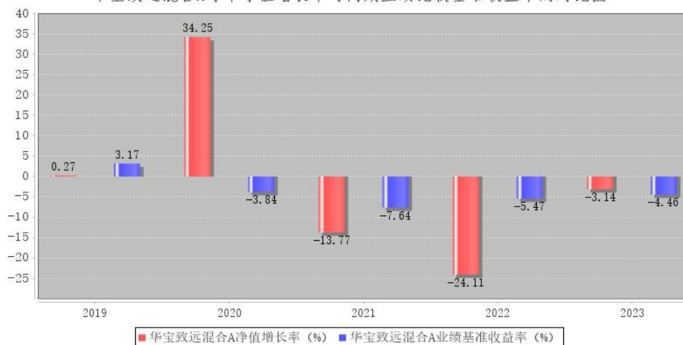
华宝致远混合A每年净值增长率与同期业绩比较基准收益率的对比图