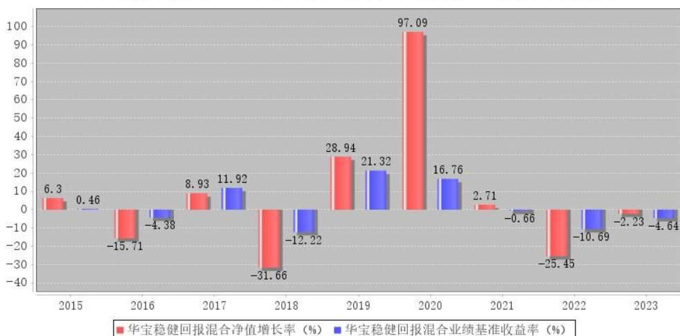
华宝稳健回报混合每年净值增长率与同期业绩比较基准收益率的对比图