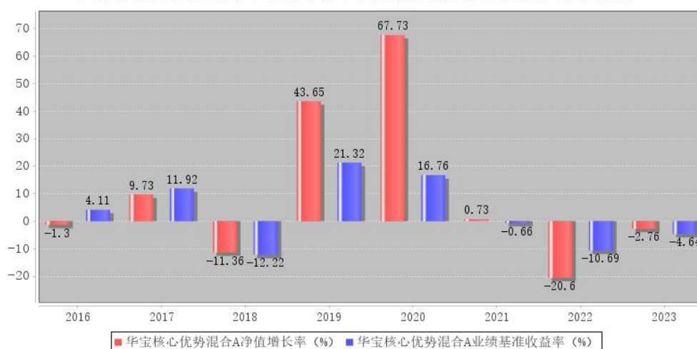
华宝核心优势混合A每年净值增长率与同期业绩比较基准收益率的对比图