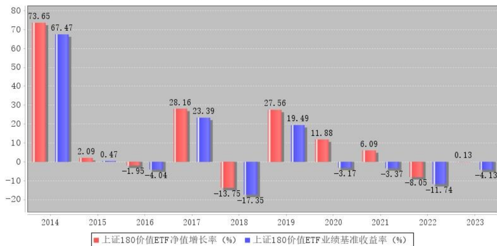
上证180价值ETF每年净值增长率与同期业绩比较基准收益率的对比图