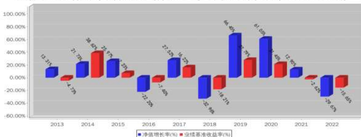
中海优质成长混合基金每年净值增长率与同期业绩比较基准收益率的对比图 (2022年12月31日)

注：数据截止日期为 2022 年 12 月 31 日，基金过往业绩不代表未来表现。基金合同生效当年不满完整自然年度，按实际期限计算净值增长率。