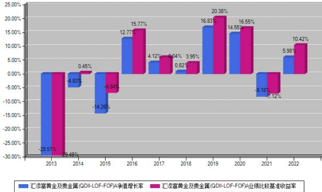
汇添富黄金及贵金属(QDII-LOF-FOF)A每年净值增长率与同期业绩基准收益率对比图

注：数据截止日期为2022年12月31日，基金的过往业绩不代表未来表现。本《基金合同》生效之日为2011年08月31日，合同生效当年按实际存续期计算，不按整个自然年度进行折算。