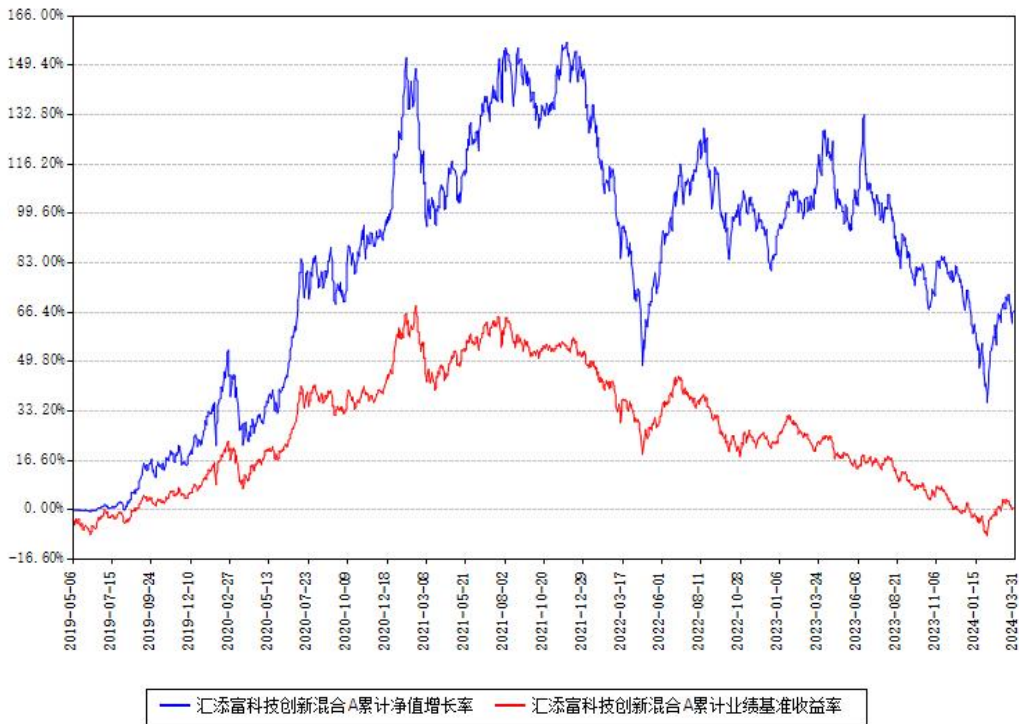
汇添富科技创新混合A累计净值增长率与同期业绩基准收益率对比图