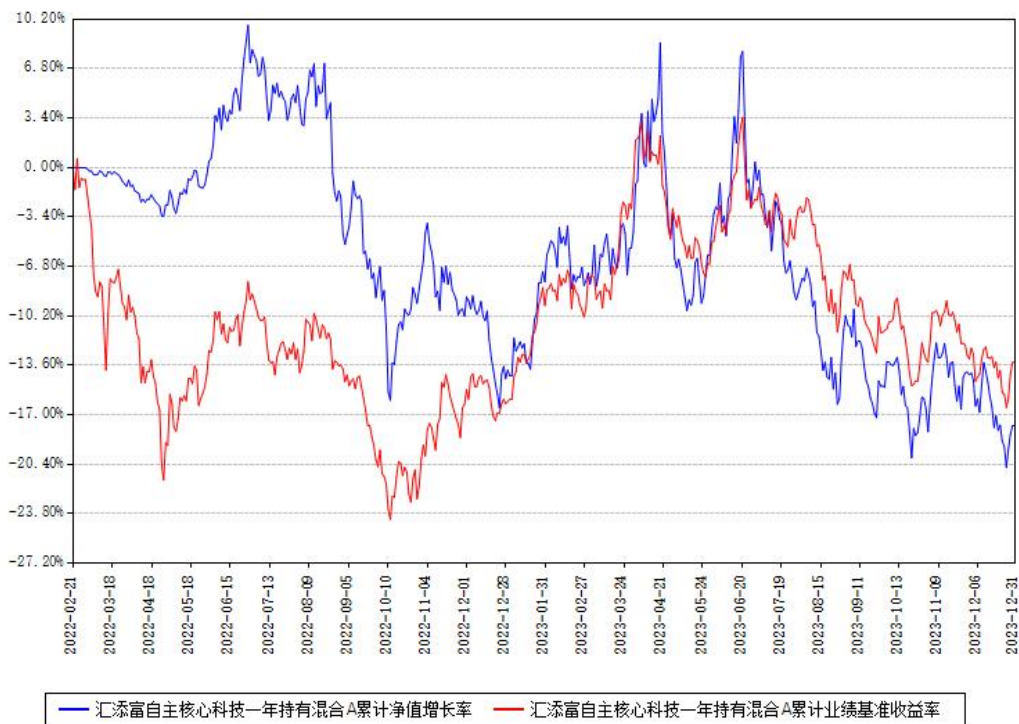
汇添富自主核心科技一年持有混合A累计净值增长率与同期业绩基准收益率对比图