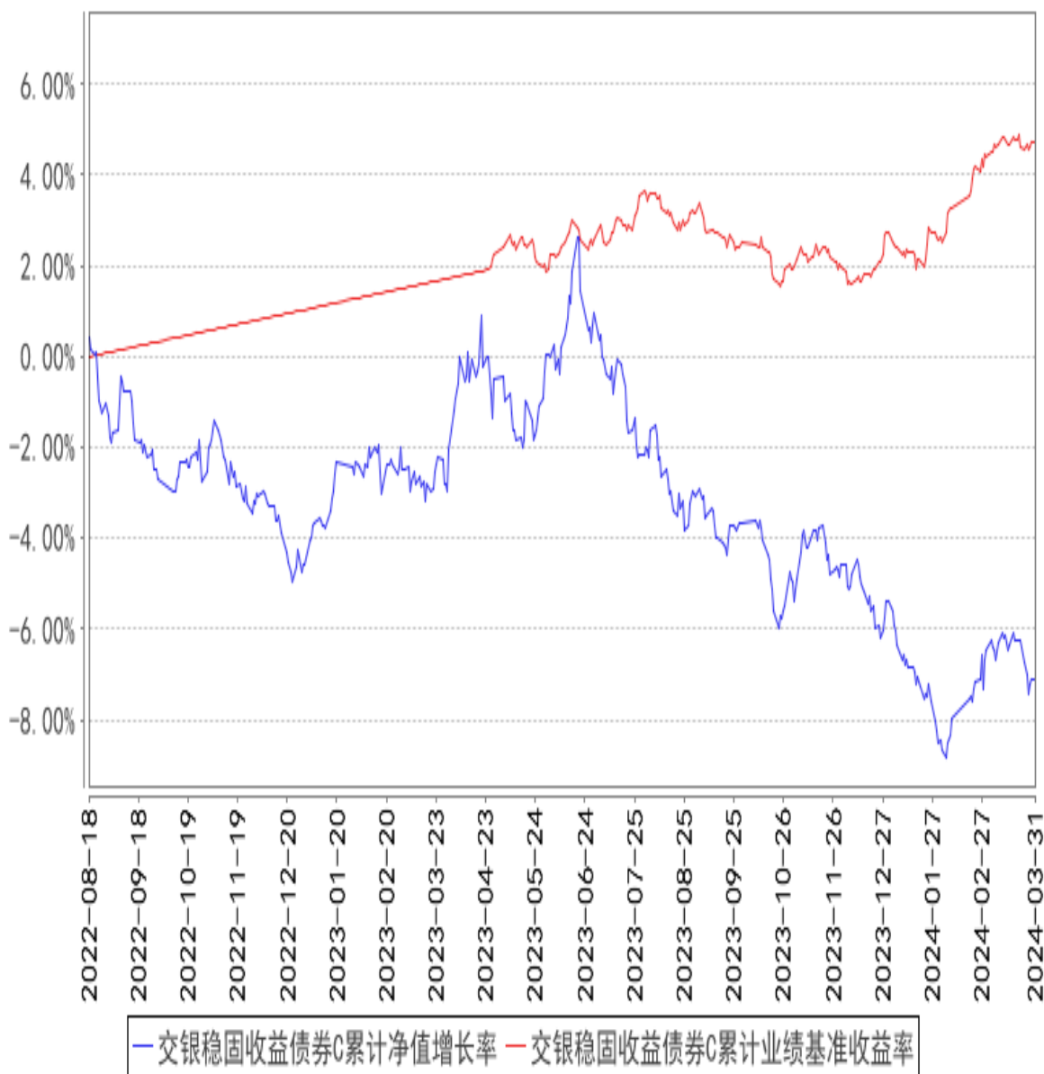
交银稳固收益债券C累计净值增长率与同期业绩比较基准收益率的历史走势对比图

注：1、本基金由交银施罗德荣祥保本混合型证券投资基金转型而来。基金转型日为2019年5月31日。本基金的投资转型期为交银施罗德荣祥保本混合型证券投资基金保本周期到期选择期截止日次日（即2019年5月31日）起的3个月。截至投资转型期结束，本基金各项资产配置比例符合基金合同及招募说明书有关投资比例的约定。