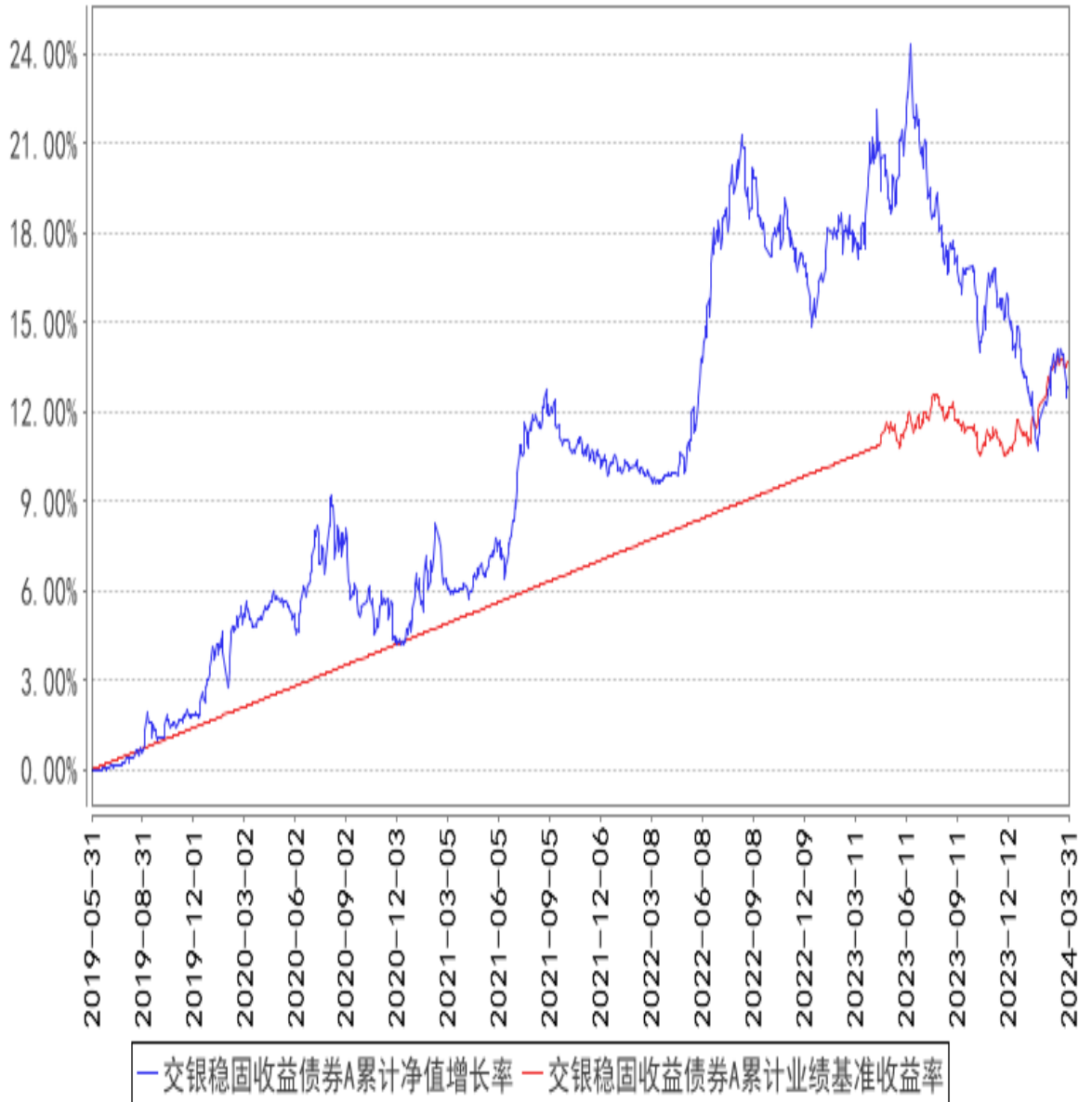
交银稳固收益债券A累计净值增长率与同期业绩比较基准收益率的历史走势对比图