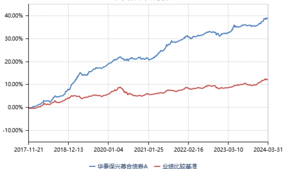
华泰保兴尊合债券 A