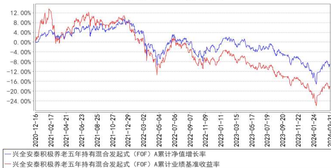
兴全安泰积极养老五年持有混合发起式（FOF）A累计净值增长率与同期业绩比较基准收益率的历史走势对比图