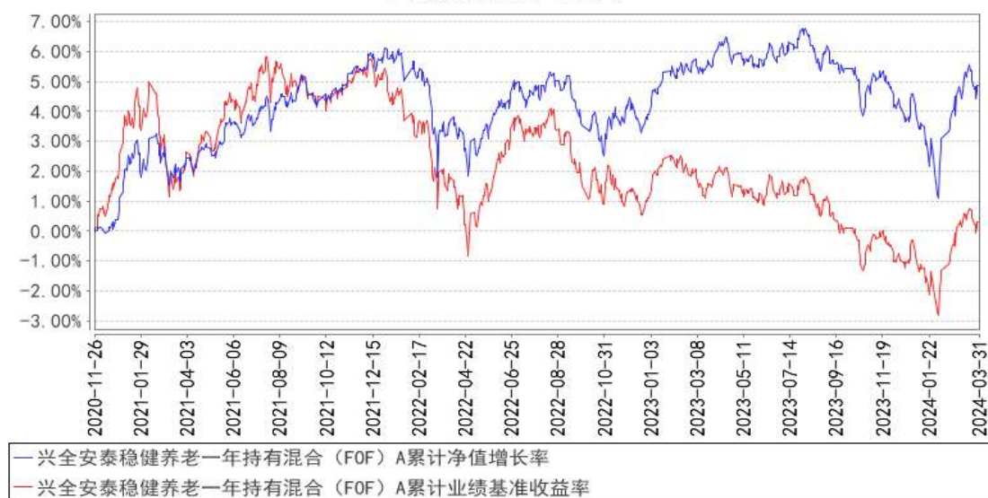
兴全安泰稳健养老一年持有混合（FOF）A累计净值增长率与同期业绩比较基准收益率的历史走势对比图