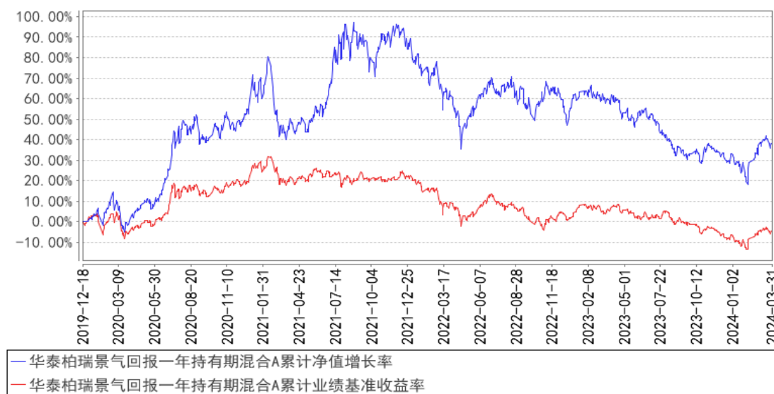
华泰柏瑞景气回报一年持有期混合A累计净值增长率与同期业绩比较基准收益率的历史走势对比图