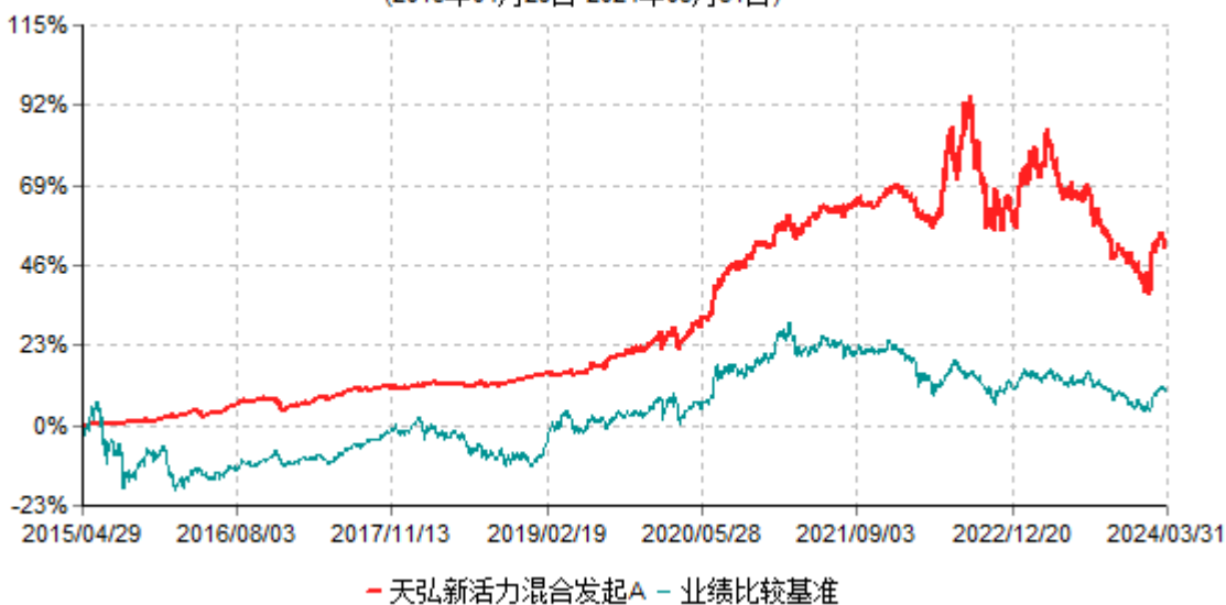
天弘新活力混合发起A累计净值增长率与业绩比较基准收益率历史走势对比图 (2015年04月29日-2024年03月31日)