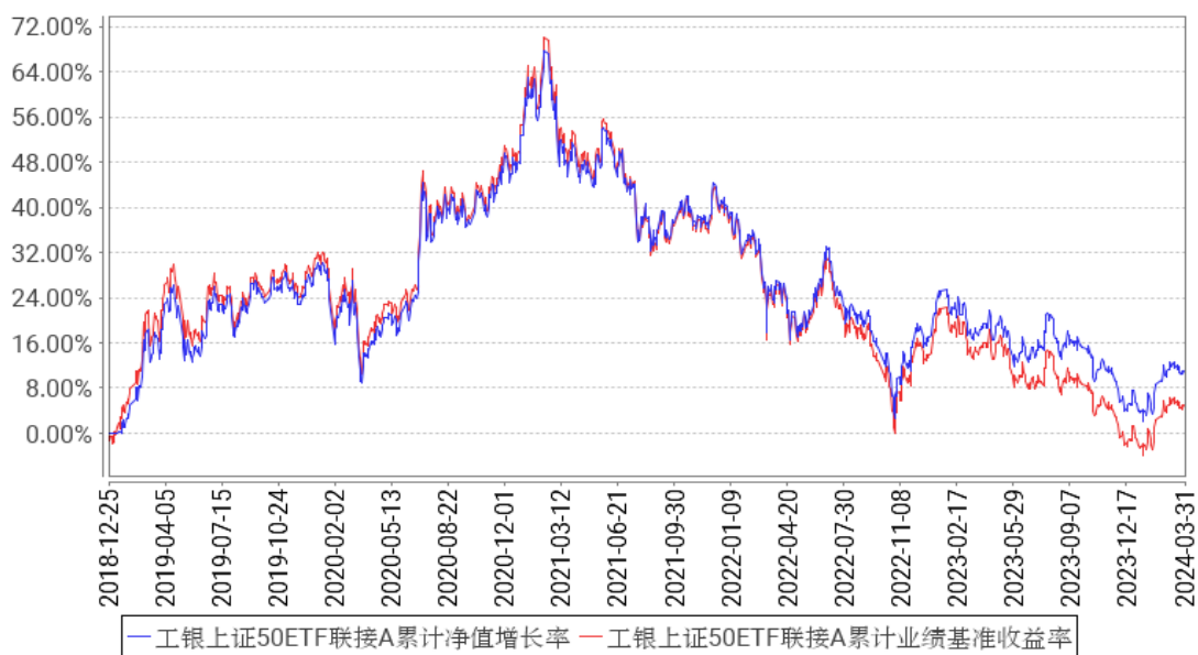
工银上证50ETF联接A累计净值增长率与同期业绩比较基准收益率的历史走势对比图