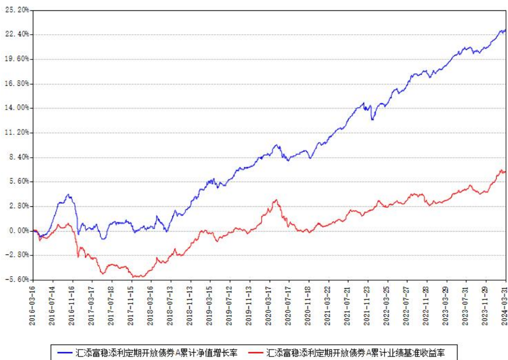
汇添富稳添利定期开放债券A累计净值增长率与同期业绩比较基准收益率对比图