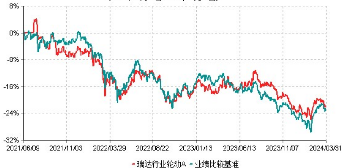
瑞达行业轮动A累计净值增长率与业绩比较基准收益率历史走势对比图 (2021年06月09日-2024年03月31日)