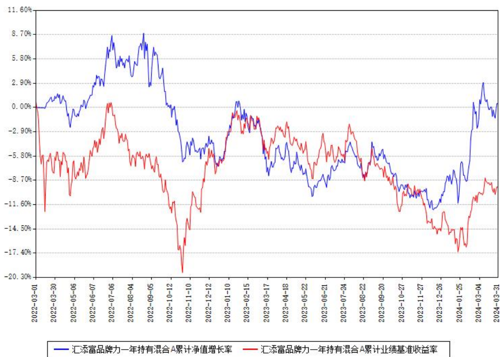
汇添富品牌力一年持有混合A累计净值增长率与同期业绩比较基准收益率对比图