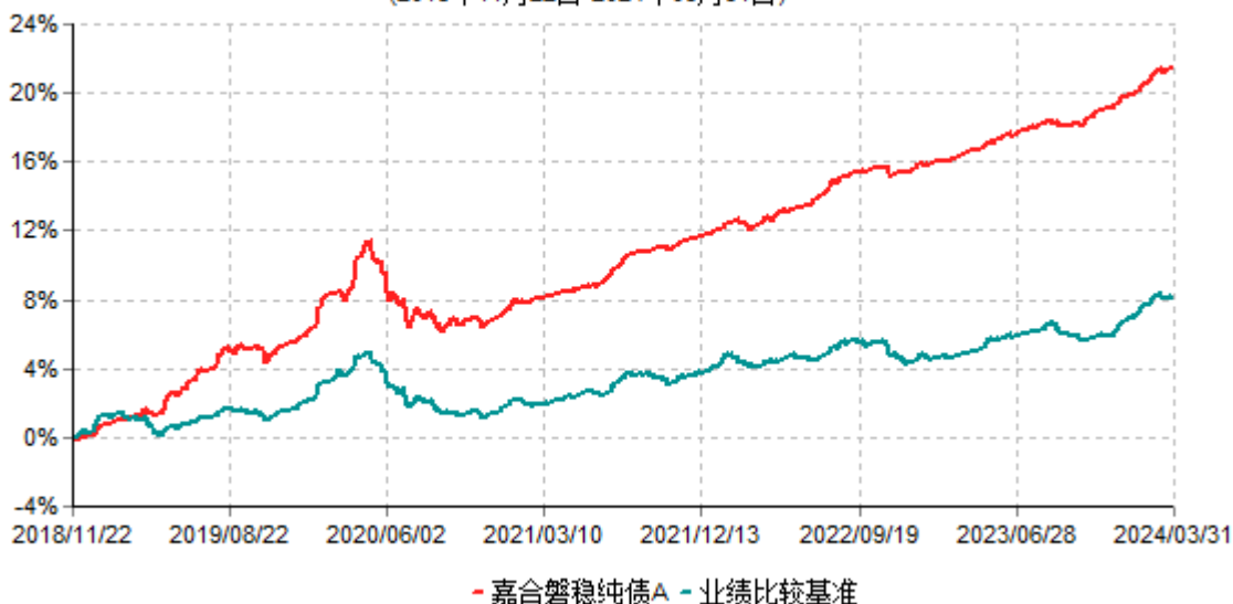
嘉合磐稳纯债A累计净值增长率与业绩比较基准收益率历史走势对比图 (2018年11月22日-2024年03月31日)