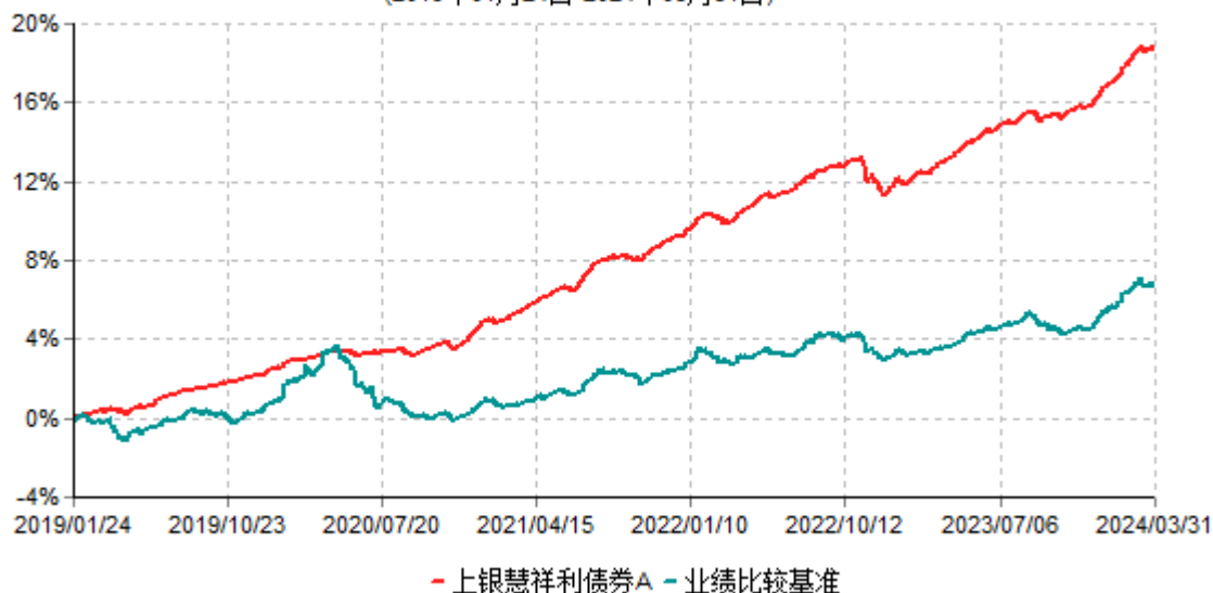
上银慧祥利债券A累计净值增长率与业绩比较基准收益率历史走势对比图 (2019年01月24日-2024年03月31日)