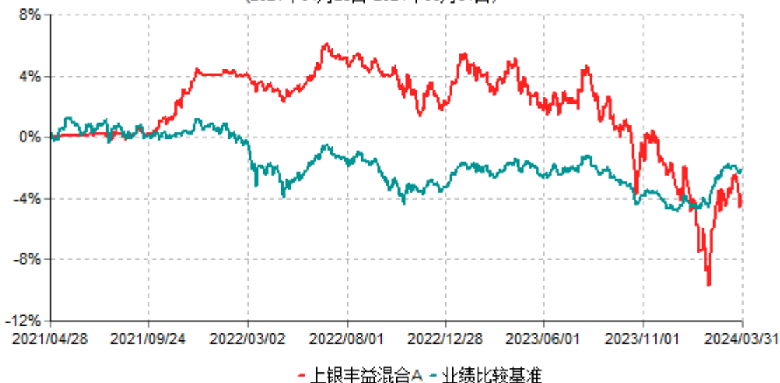
上银丰益混合A累计净值增长率与业绩比较基准收益率历史走势对比图 (2021年04月28日-2024年03月31日)