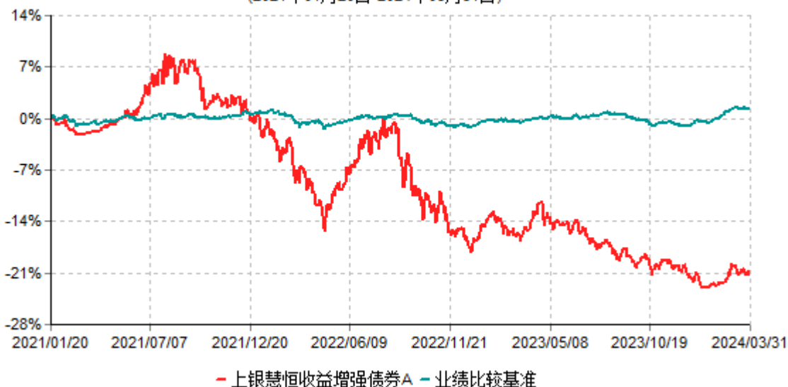
上银慧恒收益增强债券A累计净值增长率与业绩比较基准收益率历史走势对比图 (2021年01月20日-2024年03月31日)