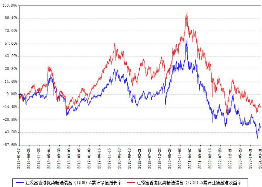
汇添富香港优势精选混合（QDII）A累计净值增长率与同期业绩基准收益率对比图