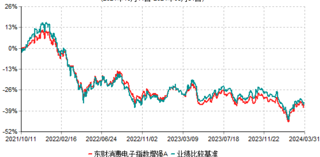
东财消费电子指数增强A累计净值增长率与业绩比较基准收益率历史走势对比图 (2021年10月11日-2024年03月31日)