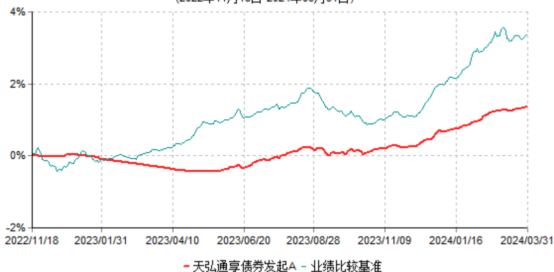
天弘通享债券发起A累计净值增长率与业绩比较基准收益率历史走势对比图 (2022年11月18日-2024年03月31日)