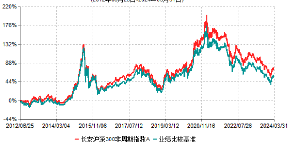
长安沪深300非周期指数A累计净值增长率与业绩比较基准收益率历史走势对比图 (2012年06月25日-2024年03月31日)

根据基金合同的规定,自基金合同生效之日起6个月内基金各项资产配置比例需符合基金合同要求。本基金在建仓期结束后,各项资产配置比例已符合基金合同有关投资比例