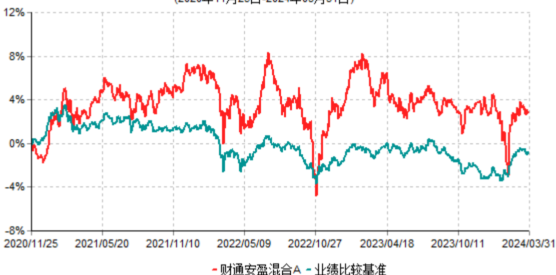
财通安盈混合A累计净值增长率与业绩比较基准收益率历史走势对比图 (2020年11月25日-2024年03月31日)