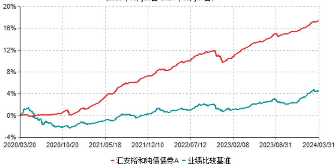
汇安裕和纯债债券A累计净值增长率与业绩比较基准收益率历史走势对比图 (2020年03月20日-2024年03月31日)