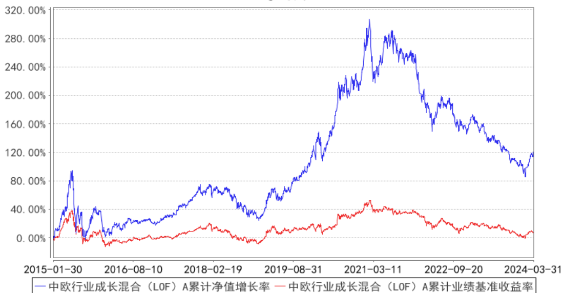
中欧行业成长混合 (LOF) A 累计净值增长率与同期业绩比较基准收益率的历史走势对比图