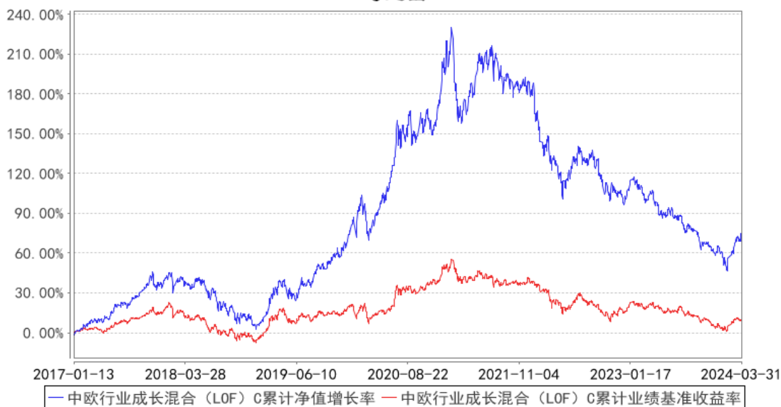
中欧行业成长混合 (LOF) C 累计净值增长率与同期业绩比较基准收益率的历史走势对比图

注：本基金自 2017 年 1 月 12 日起新增 C 类份额，图示日期为 2017 年 1 月 13 日至 2024 年 03 月 31 日。