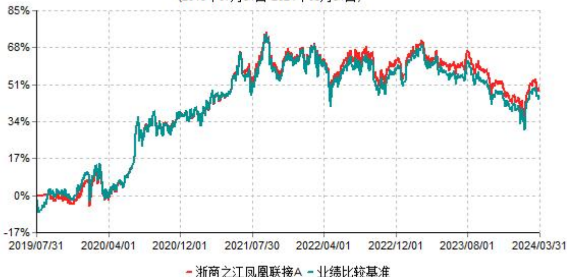
浙商之江凤凰联接A累计净值增长率与业绩比较基准收益率历史走势对比图 (2019年07月31日-2024年03月31日)

注：本基金于2023年8月31日起新增C类份额。C类基金份额合同生效日为2023年8月31日。